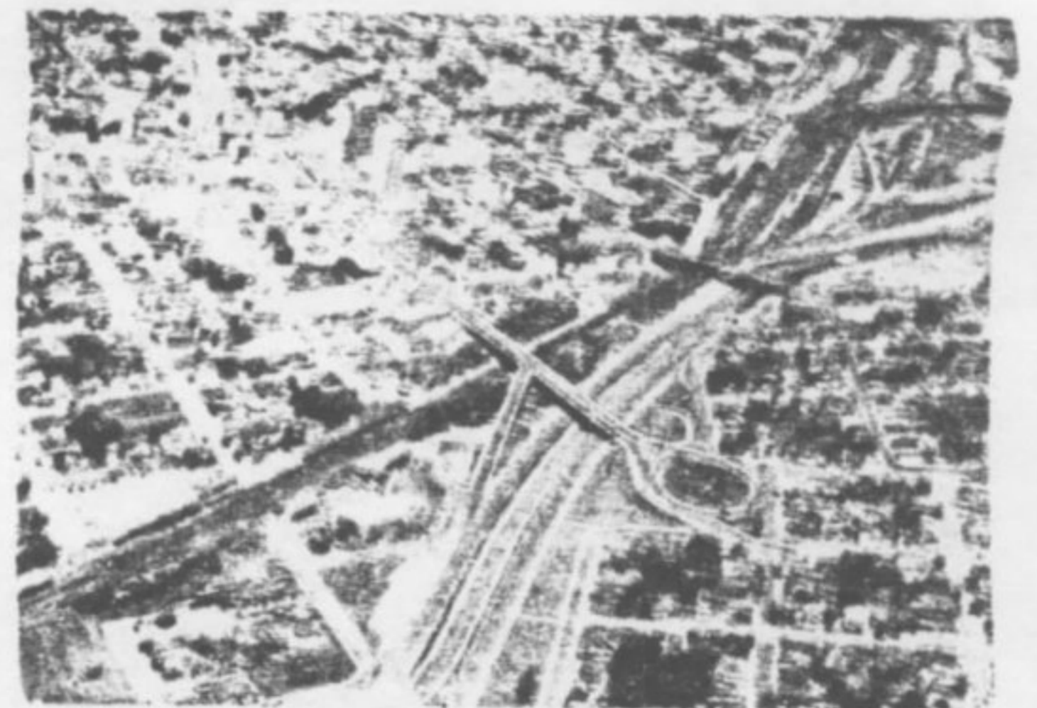
Cidades como Bauru serão beneficiadas