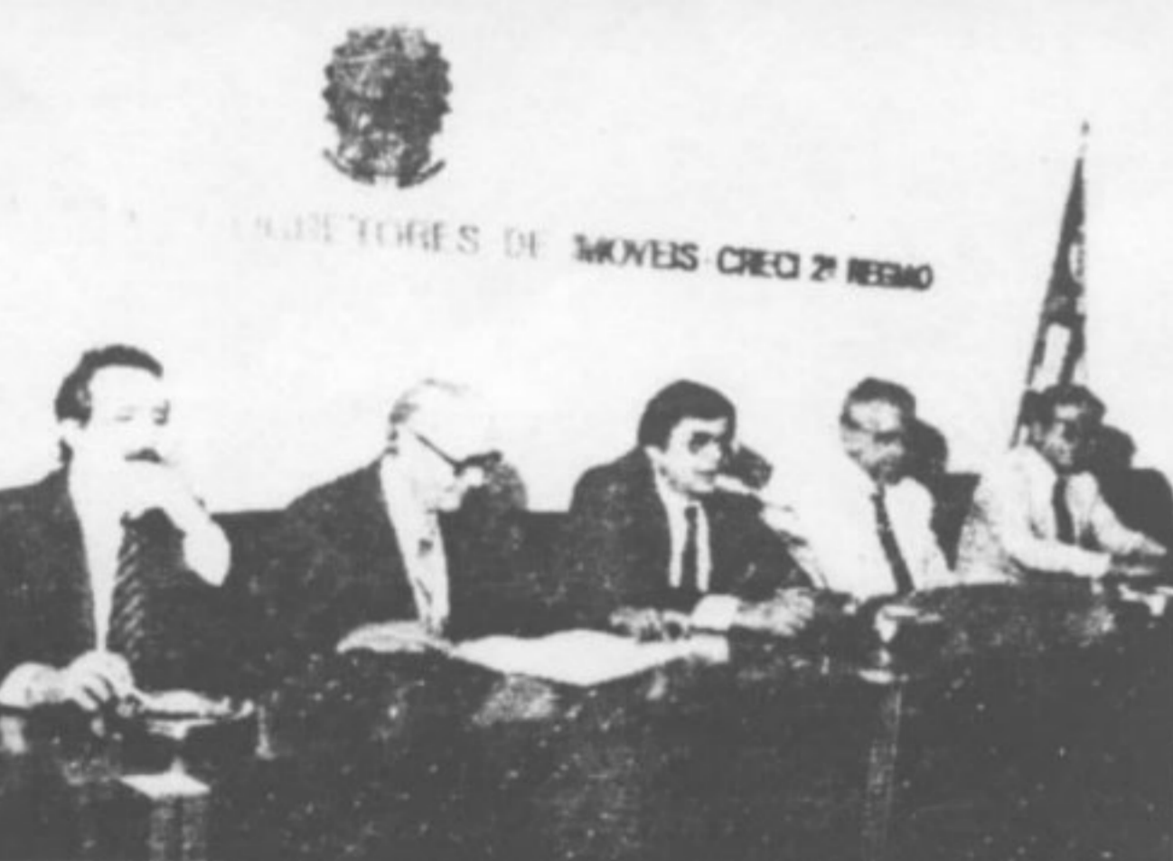
Instalação solene marcou início das atividades